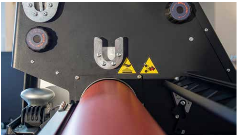
Separate Aufnahme für APP-Folie