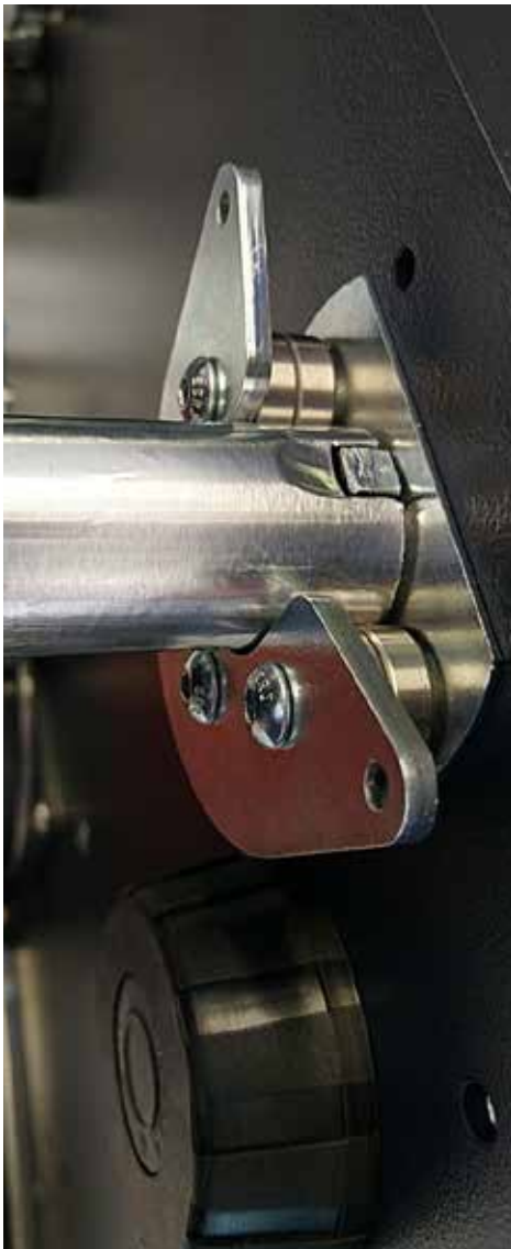
Antrieb über Bolzen-Nute-Verbindung