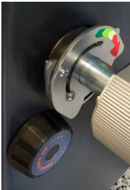
Bremsen und Rutschkuplungen für alle Achsen