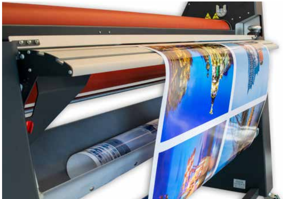
Rolle zu Rolle Laminieren